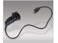
VidCap USB Camera