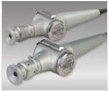
ENTityXL and ENTitySDXL

Optim eşsiz kalite ve dayanıklılığından çok emindir. ENTityXL ve ENTitySDXL arasında üreticinin parça ve işçiliğe 2 yıl garanti ve tüm Optim ürünler için ekstradan Ek 1 yıl veya 2 yıl uzatılmış garanti satın alabilirsiniz. Size kolaylık için biz seçeneği sunuyoruz.