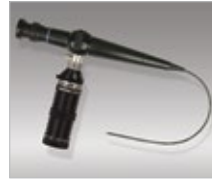
ENT 3.6 Flexible Nasopharyngoscope Model FP with PLS attached