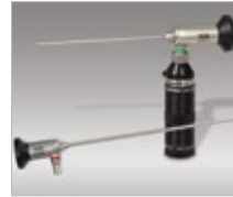
Rigid Sinusopes with PLS attached