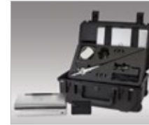
Mobile FEES System