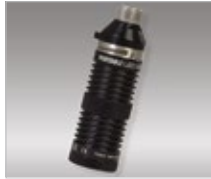
Portable LED Light Source (PLS)